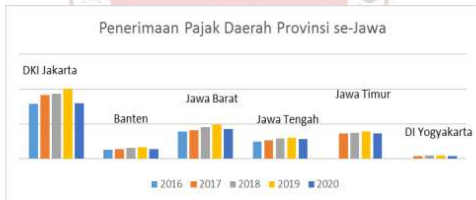
Gambar 1.1 Penerimaan Pajak Daerah Provinsi se-Pulau Jawa

Menurut aturan di dalam undang-undang 12 Tahun 2019 mengenai Pengelolaan Keuangan Daerah Pajak Daerah termasuk kedalam sektor PAD. Besarnya pajak daerah sekaligus memberikan gambaran kemandirian fiskal daerah.